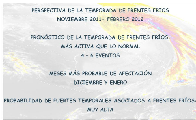
Figura 3. Perspectiva de la temporada de frentes fríos 2011-2012.